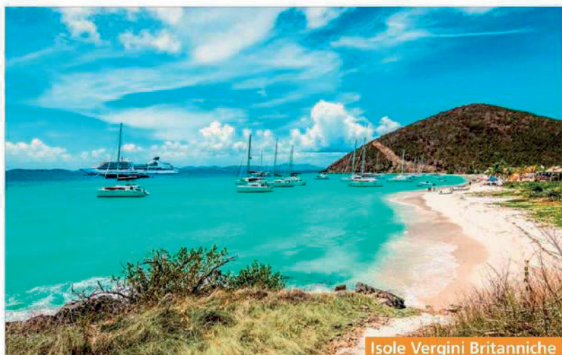
Isole Vergini Britanniche