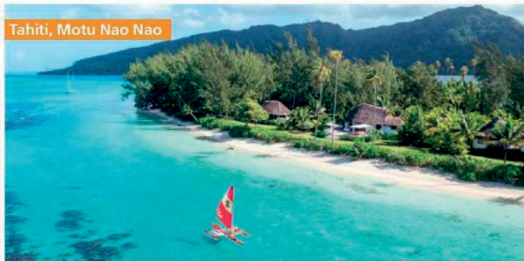
Tahiti, Motu Nao Nao