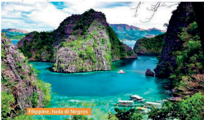
Filippine, Isola di Negros

ticare uno dei resort a 5 stelle di lusso più incantevoli di tutte le Mauritius: l'Oberoi Beach Resort, considerato il miglior hotel dell'isola. Situato direttamente sulle bianche spiagge di Turtle Bay, un parco marino naturale, questo resort offre ai propri ospiti degli alloggi sotto ai tradizionali tetti di paglia, resi sicuri da tecniche di costruzione moderne. Le abitazioni si affacciano su giardinetti e piscine private e, dagli arredi interni allo stile dei giardini, tutto è realizzato in stile tradizionale, per far sì che l'ospite possa immergersi nella cultura locale fino in fondo.