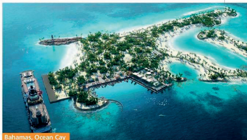
Bahamas, Ocean Cay

affascinante «resort» galleggiante senza preoccuparvi di nient'altro che non sia rilassarvi e godervi la vista. Provate solo a immaginare di svegliarvi a bordo di una barca a vela nel porto di un'isola dell'arcipelago, navigare verso un nuovo isolotto e continuare a viaggiare verso nuove mete per qualche giorno. Non vi sentite già dei corsari in erba?