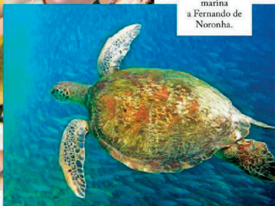
Tartaruga marina a Fernando de Noronha.