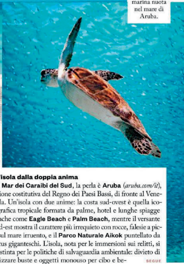
Una tartaruga marina nuota nel mare di Aruba.

S egui lo scudo e le pinne e arriverai in acque da sogno. Eh sì, sono proprio le tartarughe marine con l'inconfondibile carapace a tracciare le rotte verso i mari più belli del Pianeta. Già, perché questi placidi rettili - tra i più antichi tetrapodi del mondo - scelgono come proprio habitat naturale i luoghi più intatti della Terra. Ma non solo. La loro presenza è un ottimo indicatore sulla salute dell'ecosistema marino -costiero: si nutrono soprattutto di meduse e alghe, e in età matura ritornano sugli arenili dove nacquero per deporre le uova. Senza contare che sono un'attrattiva per il turismo, nuotare in modo rispettoso con loro è un'esperienza indimenticabile. Ma non bisogna dimenticare che le tartarughe marine sono inserite nella lista rossa della Iucn (Unione Internazionale per la Conservazione della Natura, iucn.it ) tra le specie a rischio di estinzione. Purtroppo. Ecco quattro mete nel mondo che si potrebbero considerare a tutti gli effetti "Turtle Fan", luoghi splendidi da esplorare, sopra e sotto il mare.