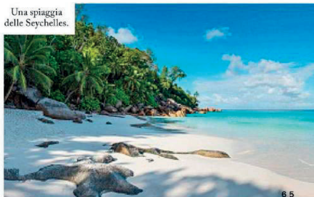
Una spiaggia delle Seychelles.