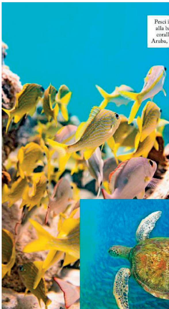
Pesci intorno alla barriera corallina di Aruba, Caraibi.